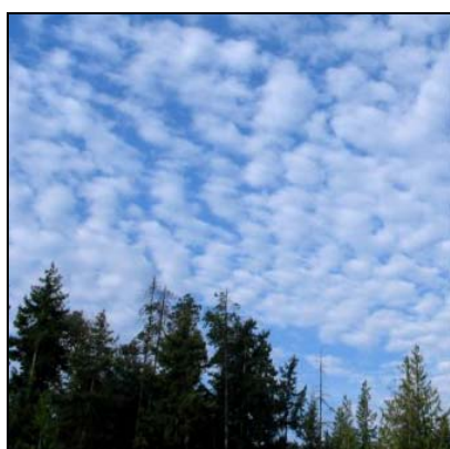
المزن الركامية أو الركام المزن