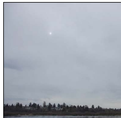
السحاب الطباقى المتوسط