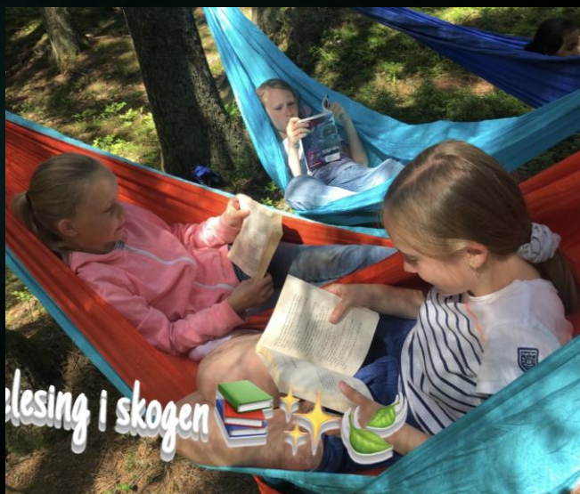
lesing i skogen