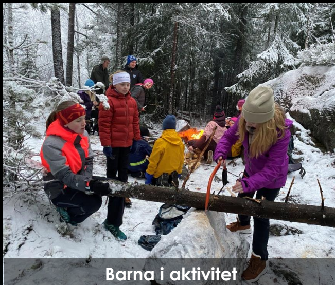
Barna i aktivitet