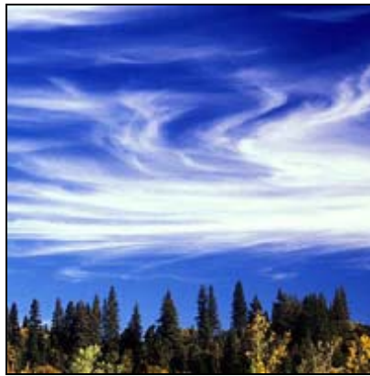
เซอรัส Cirrus, Ci