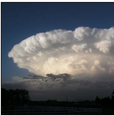
คิวมูโลนิมบัส Cumulonimbus, Cb