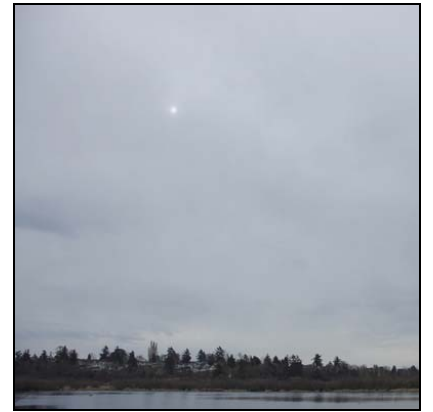
อัลโตสเตรตัส Altostratus, As