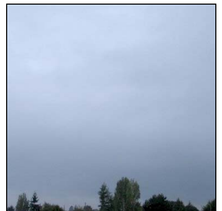
นิมโบสเตรตัส Nimbostratus, Ns

NATURFAGSENTERET NASJONALT SENTER FOR NATURFAG I OPPLÆRINGEN