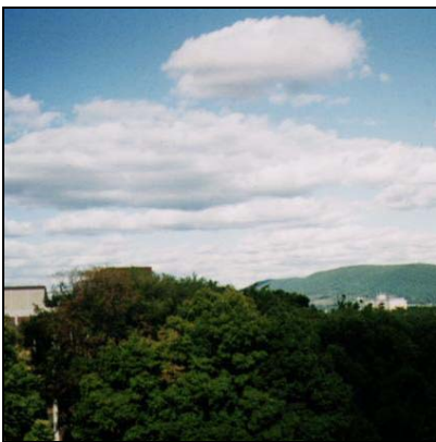
คิวมูลัส Cumulus, Cu