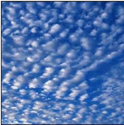
อัลโตคิวมูลัส Altostratus, As