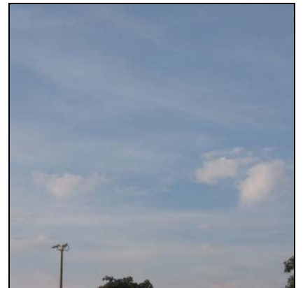
เซอโรสเตรตัส Cirrostratus, Cs