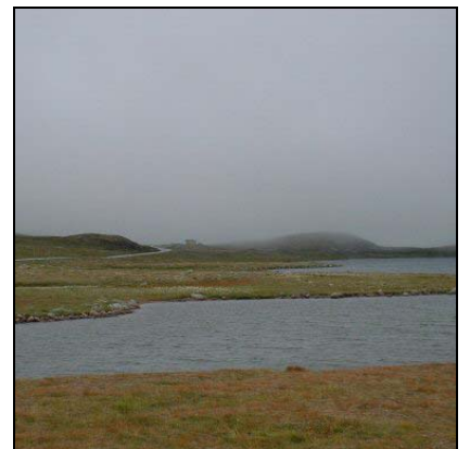
สเตรตัส Stratus, St