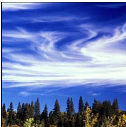
Fjærtskyer Cirrus, Ci