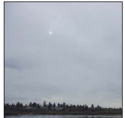
Lagskyer Altostratus, As