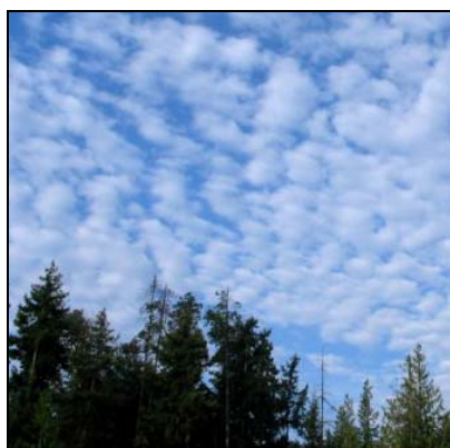
Bukleskyer Stratocumulus, Sc