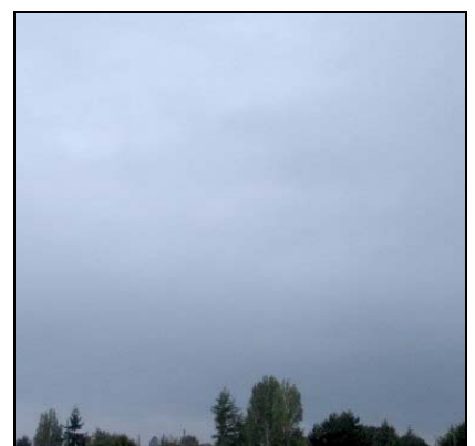
Nedbørskylag Nimbostratus, Ns

NATURFAGSENTERET NASJONALT SENTER FOR NATURFAG I OPPLÆRINGEN