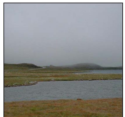
Tåkeskyer Stratus, St