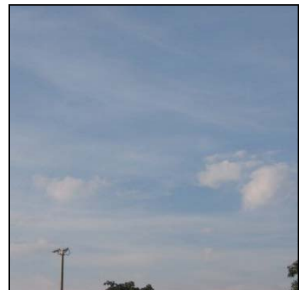
Slørtskyer Cirrostratus, Cs